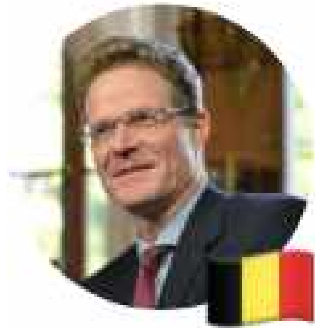
Nikolaus MEYER-LANDRUT Ambassadeur d'Allemagne

Je suis heureux que "L'Officiel du Handicap" ait identifié l'Allemagne comme un pays avec des expériences importantes en la matière, méritant d'être partagées et je suis honoré de l'invitation à la conférence du mois de mars.